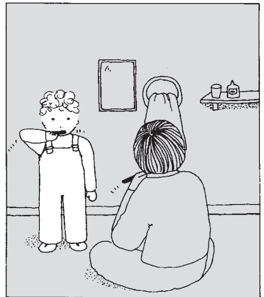
Dessins: Marie Kirchner