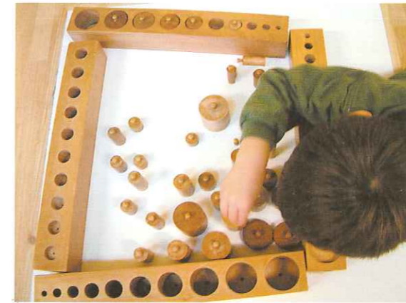
Les emboîtements solides.