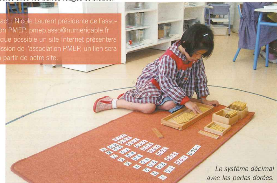
Le système décimal avec les perles dorées.