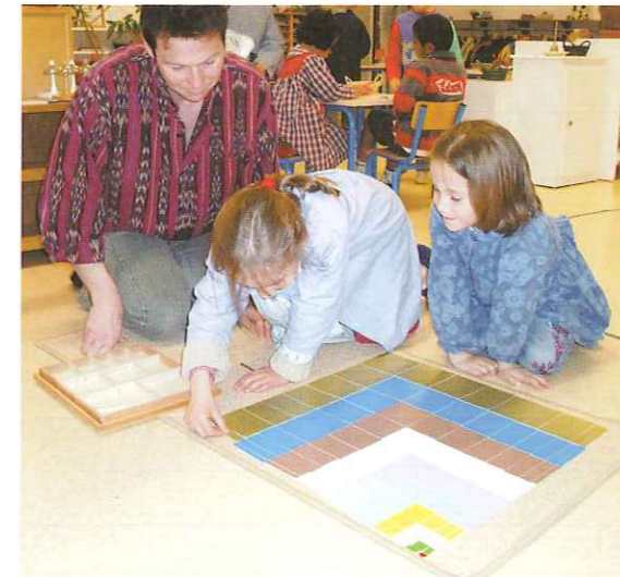
La table de Pythagore sensorielle.