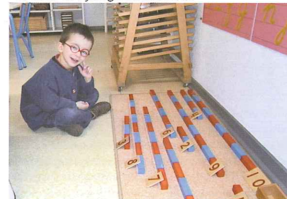
Quantités et symboles avec les barres rouges et bleues.